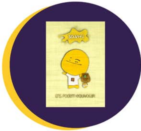
Ems podem equivocar 2013