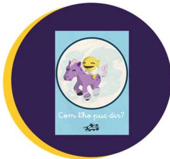
Com t'ho puc dir? 2014