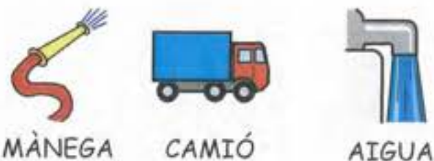
MÀNEGA CAMIÓ AIGUA